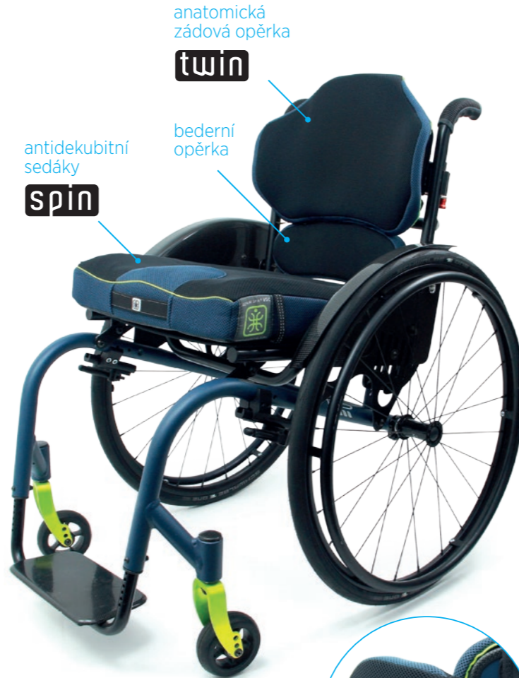
výškově stavitelné boční peloty*