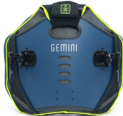
GEMINI TWIN M BE SEEN LINE*