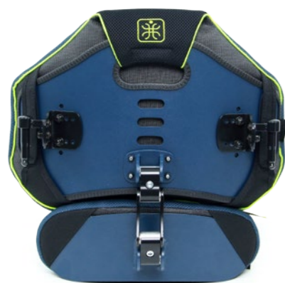
GEMINI TWIN S + bederní opěrka