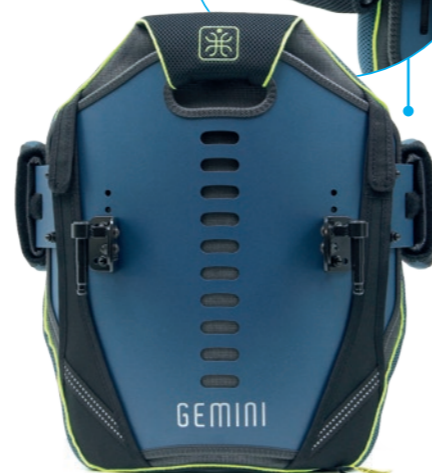
GEMINI TWIN L + boční peloty*